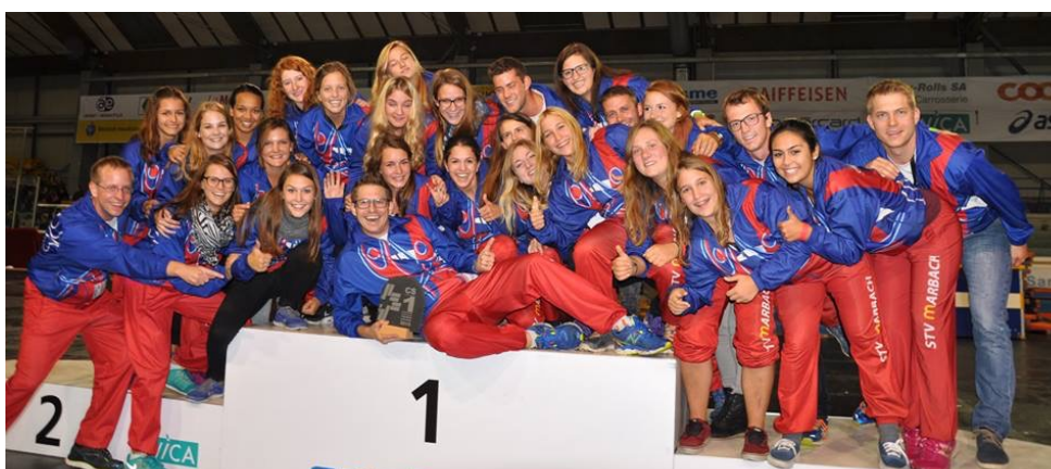
STV Marbach: 1. Rang in der Disziplin Grossfeldgymnastik mit der Note 9.55