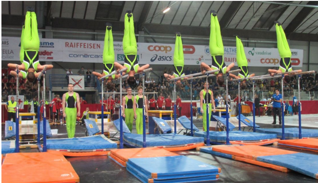
STV Kriessern: 7. Rang in der Disziplin Barren mit der Note 9.50