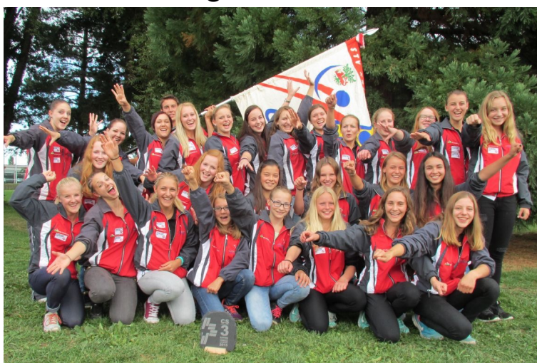
STV Kriessern: 3. Rang in der Disziplin Schulstufenbarren mit der Note 9.60

Aus unserem Verbandsgebiet starteten 4 Vereine an den Schweizermeisterschaften im Vereinsturnen und erzielten tolle Resultate. Der Vorstand vom Kreisturnverband gratuliert allen Teilnehmerinnen und Teilnehmer herzlich. Wir freuen uns auf das Heimspiel im nächsten Jahr, am 10./11. September 2016 in Widnau, organisiert vom STV Marbach.