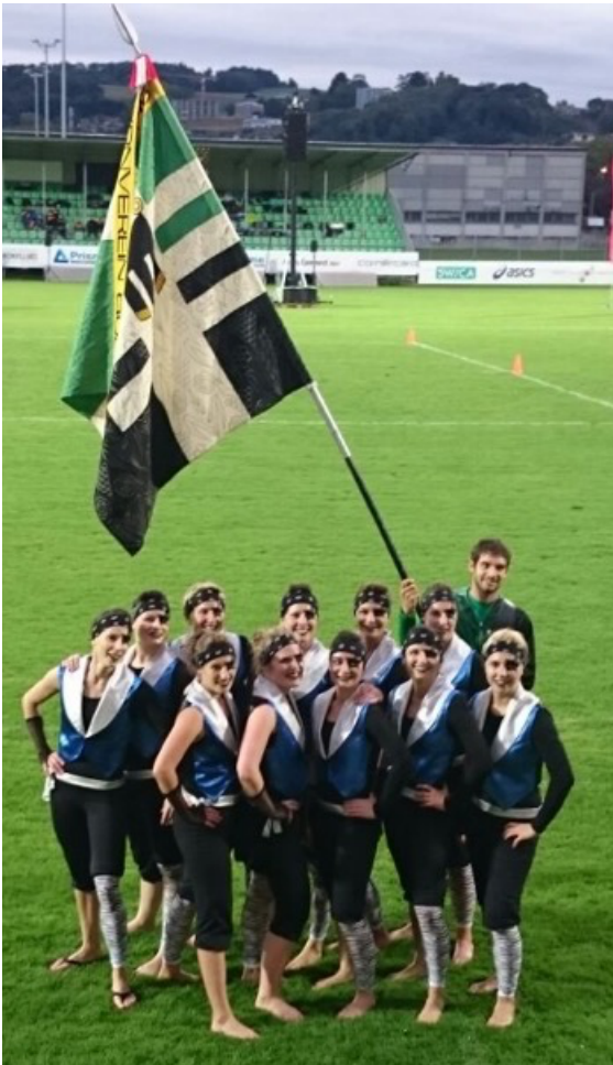
TV Buchs: 2. Rang in der Disziplin Kleinfeldgymnastik mit der Note 9.89