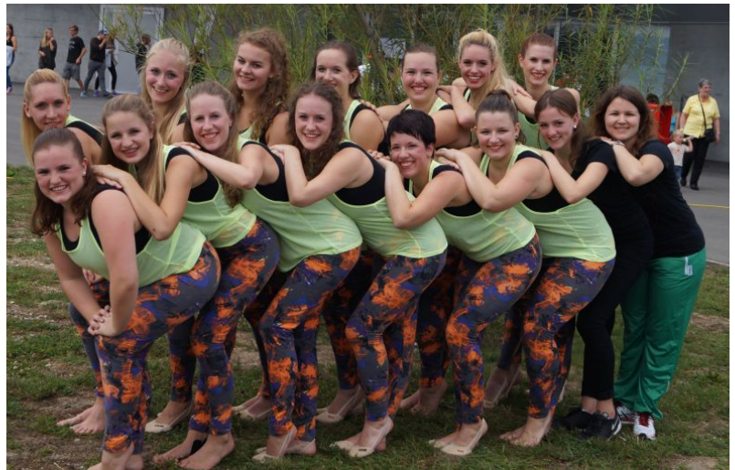
STV Balgach: 17. Rang in der Disziplin Gymnastik Bühne mit der Note 9.03