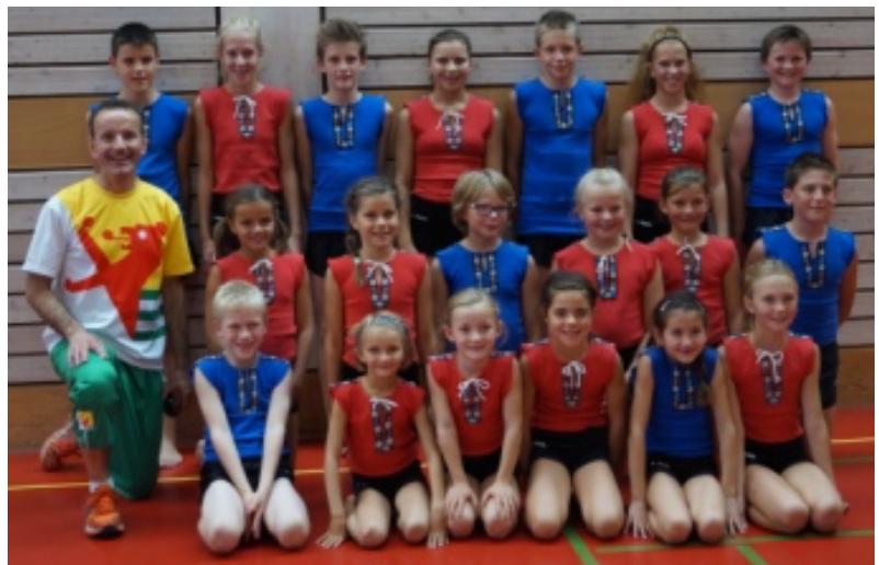
STV Balgach: 17. Rang in der Disziplin Boden mit der Note 8.95